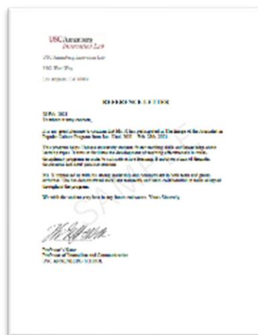
学员推荐证明信（示例）