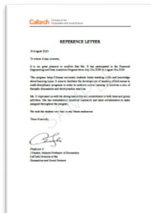
学员推荐证明信（示例）