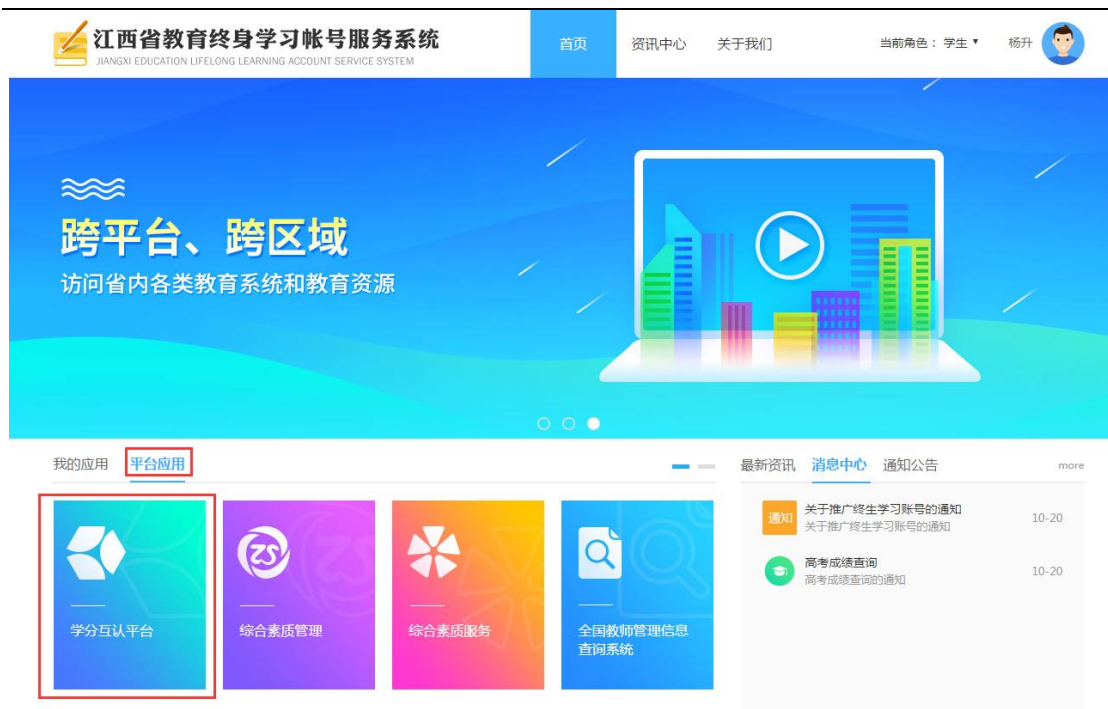
图1-2 终身学习账号服务系统登录后的界面