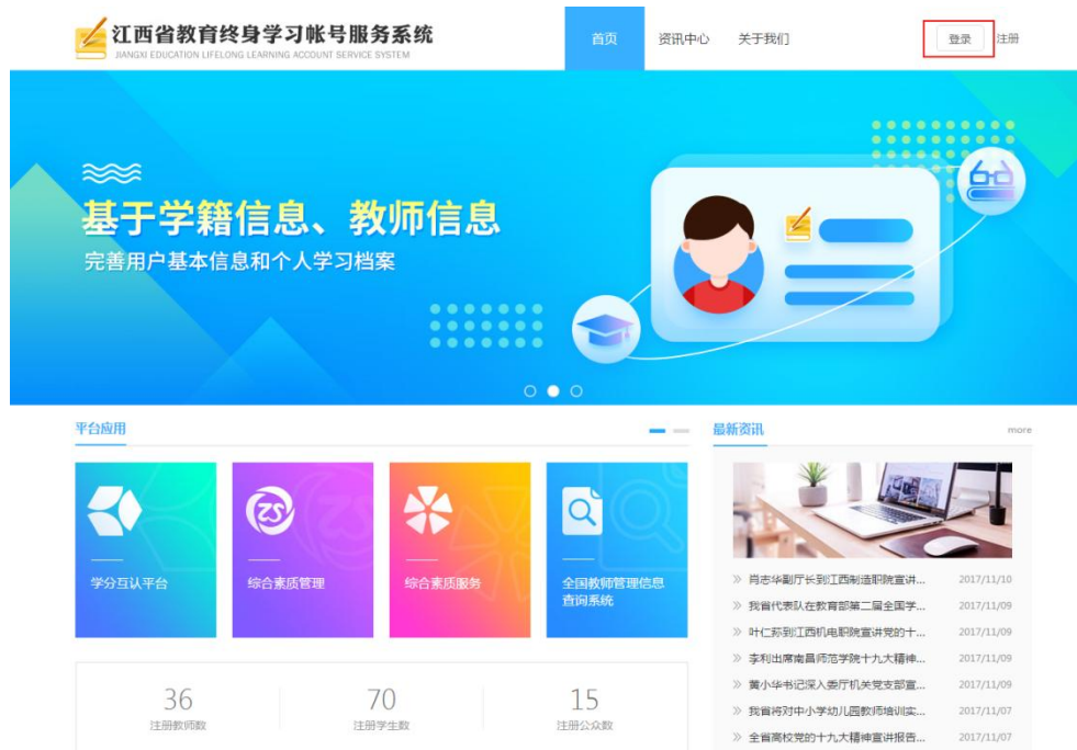
图1-1 终身学习账号服务系统界面

打开教育厅主页： http://11a.jxedu.gov.cn/ ；进入“江西省教育终身学习账号服务系统”，如图 1-2。