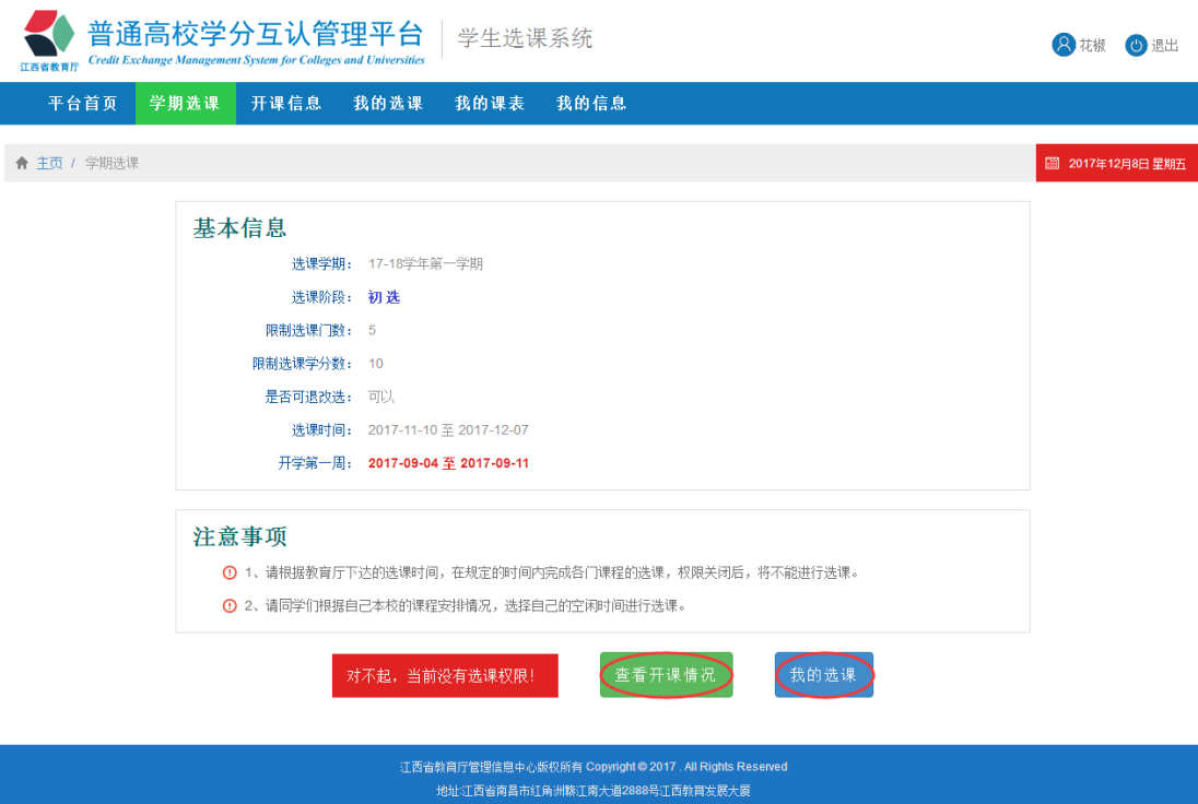
图1-5 权限未开放状态下的学期选课界面

点击页面下方 查看开课情况 按钮，进入开课信息界面（参见后述（3）开课信息）；点击页面下方 我的选课 按钮，进入我的选课界面（参见后述（4）我的选课）。