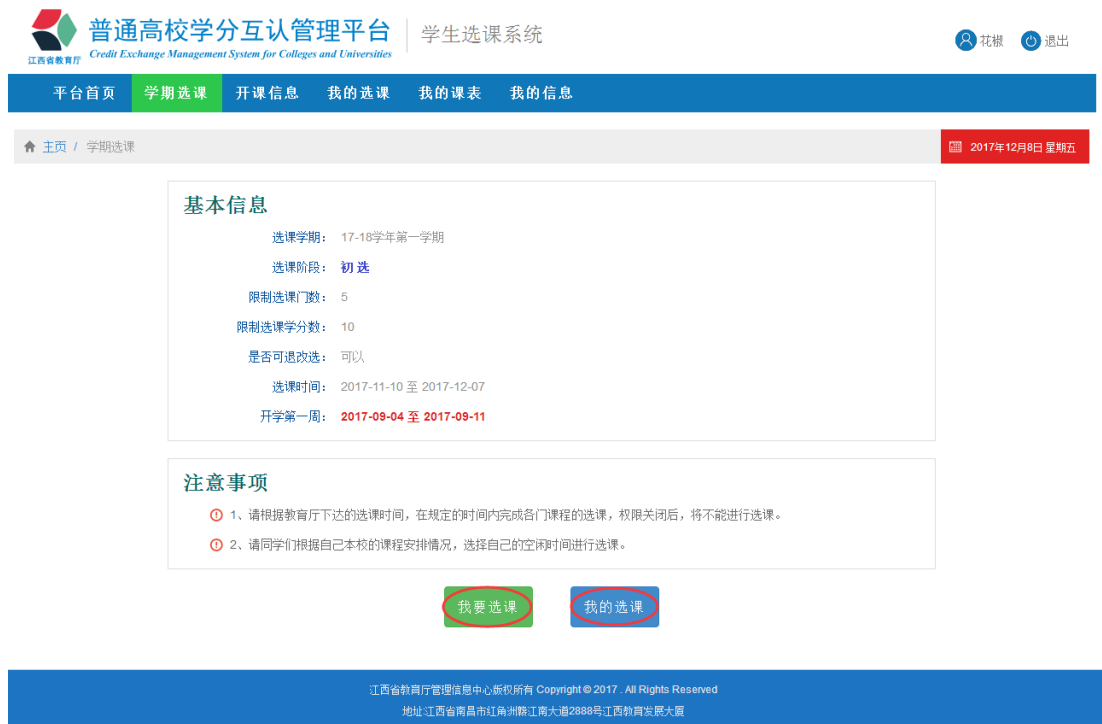
图1-4 权限开放状态下的学期选课界面

➤ 若选课权限开放，页面底部提供两个操作按钮“我要选课”和“我的选课”，如图 2-1。